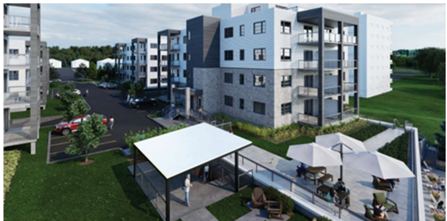
Plan d'aménagement du site